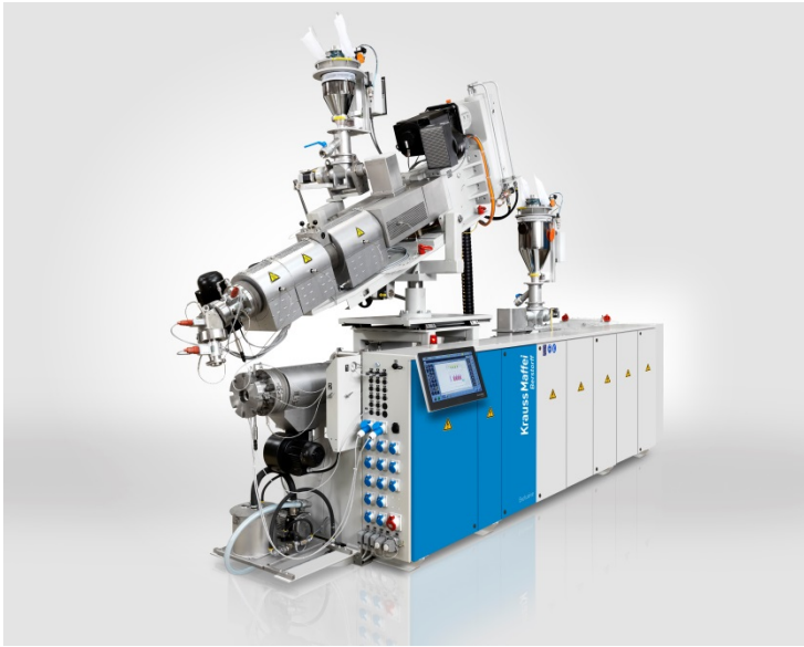
写真 3:窓枠プロファイル用コエクストルージョン